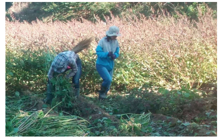
収穫を手伝う娘達

10月8日、エゴマの刈りとりを行いました。2度の台風影響もあって、穂先の方は風で既に脱粒してしまいました。本来であればもう少し後に刈り取るのですが、連休で休みの娘達や、近所の方々にも手伝ってもらって作業を行いました。刈り取って束ねたエゴマの束を自然乾燥し、後日脱穀します。その後も色々な作業工程を経て搾油へと進みます。エゴマ油は大変な手間暇が掛かる貴重な油です。