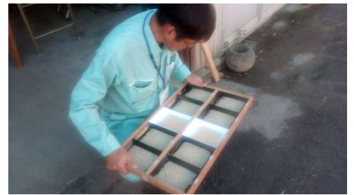
穀物検査員による米検査

岩手の秋も日ごとに深まり、里山の木々の葉も少しずつ色づいて来ました。あの猛暑が嘘のように朝晩の冷え込みも強まり、日没も早まって相変わらず慌ただしく野良仕事に追われています。我が家のお米をご活用頂いている皆様には、引き続きご購入頂きまして誠にありがとうございます。心より感謝申し上げます。 9月19日から始まった稲刈りも10月16日をもって約25haの稲刈りを終了しました。先月のお便りで豊作間違いなしと記しましたが、あに凶らんや場所によっては冷害だった昨年よりも穫れませんでした。それでも御上が発表する米の作況指数は、岩手100の「平年並み」。私が住む岩手県南部は102の「やや良」とのことです。現場の感覚からすると、首を傾げたくになります。結局8月初めの出穂期から開花期に掛けて高温が続き、十分に受粉出来ない障害が出たものと思われまます。寒くてもダメ。暑すぎてもダメ。本当に農業って難しいですね。今年のは天候に恵まれ？相当期待していただけにショックです。因みに品質の方は申し分ないようです。穀物検査の結果、全量文句なしの「一等米」に格付けされました。食味計による測定でも、全圃場のサンプル検査の結果、78点～80点を計測しました。当地域の平均値が75点で、80点を超えるものは数パーセントしかありません。どうぞ新米の味をご賞味ください。