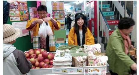
物産展初デビュー

武蔵小山商店街物産展 今年も10月28日~30日まで東京武蔵小山商店街パルクで物産展に参加してきました。今年で26回目にもなりますので、すっかり顔なじみになったお客様も多く、お客様の生の声を聞くことが出来るとても有意義な場となります。私は初日と翌日午前中だけ店頭立ち、後は就活も終えて時間を持て余している娘にバトンタッチしたのですが、意外や意外、最終日にモノが足りなくなる程の盛況でした。本人もお客様から「来年も来てネ」と声を掛けられてまんざらでもなかったようです。やっぱりもう私の出番ではないのかも知れません。