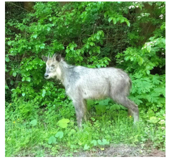
天然記念物 ニホンカモシカ

カモシカがひょっこり 軽トラを駆って農道を走っているとカモシカと遭遇。その距離2m程、手を伸ばせば触れるほどの距離です。全く警戒するでもないの、スマホを取り出してパチリ。以前にも書きましたが、近頃野生動物との距離が近づいています。ツキノワグマや日本鹿の目撃情報は絶えませんし、イノシシによる農作物被害も耳にするようになってきました。農業者として、彼らとの共存は頭の痛い問題です。