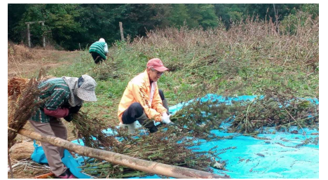
エゴマの刈り入れ

新米感謝価格 今月は新米感謝価格と銘打って、定期購入を頂いた皆様へは200円/5kgの値引を行っております。生産者にとっては、かつてない低米価の時代に、皆様とのお付き合いは大変大きな励みになります。本当にどうもありがとうございました。